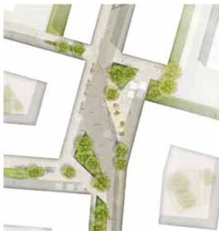
Blick von oben auf die Achsen.

Das gesamte Gelände ist autofrei – nur Anlieferungen und das Parken auf Behindertenstellplätzen in den Nebenachsen ist erlaubt. Die Verbindung vom Nord- zum Südkopf ist eine belebte Hauptachse. Daran gliedern sich eine Vielfalt an verschiedenen Nutzungsflächen an, die zum Arbeiten, Verweilen oder zu diversen sportlichen Aktivitäten einladen. Die Nebenachsen