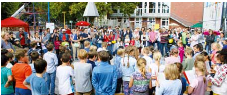
Beliebter Treffpunkt für Menschen aller Nationalitäten: das Stadtteilfest – hier auf dem Gelände der Grundschule Kreyenbrück.

„Kreyenbrück treibt es bunt“: In diesem Jahr feiert der Stadtteil bereits vor den Sommerferien. Am Freitag, 21. Juni 2019, treffen sich die Quartiersbewohner ab 15 Uhr auf dem Gelände der Katholischen Kirchengemeinde St. Michael an der Klingenbergstraße, um gemeinsam zu feiern. Längst hat sich die Veranstaltung zu einem beliebten Treffpunkt für Jung und Alt aller Nationalitäten entwickelt. Inzwischen gehören dem Arbeitskreis Kreyenbrück, der das Fest organisiert, über 25 Institutionen aus dem