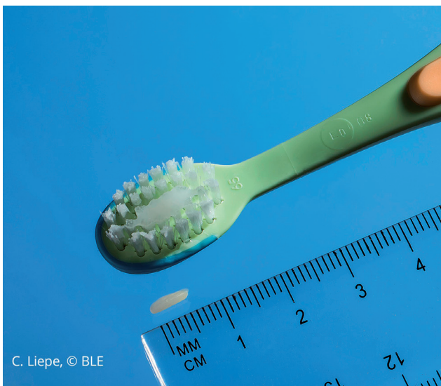
C. Liepe, © BLE