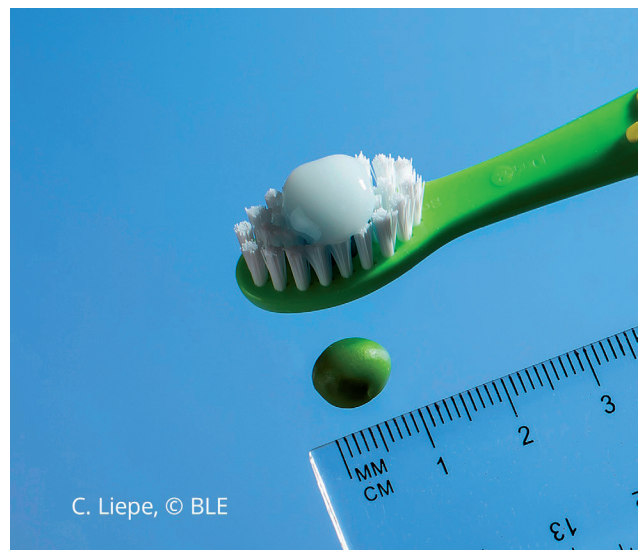
C. Liepe, © BLE