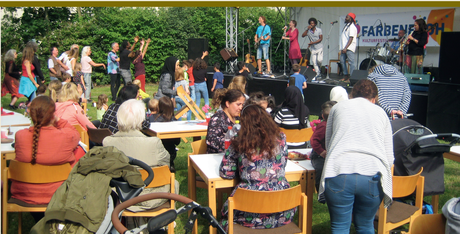
Ausgelassene Stimmung herrschte auf dem Stadtteilstfest im Juni