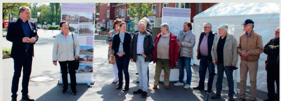
Eröffnete den „Tag der Städtebauförderung“ auf dem Klingenbergplatz: Oberbürgermeister Jürgen Krogmann.

Die Mädchen und Jungen im Wohnbereich Frankfurter Weg/Marburger Straße warten noch auf die Erneuerung ihres Spielplatzes: Sie waren an der Planung beteiligt.