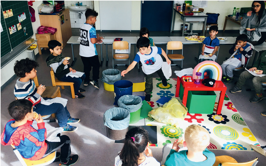
Sammelten und sortierten Müll: Kinder der Grundschule Kreyenbrück